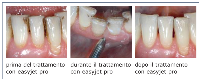
prima del trattamento con easyjet pro durante il trattamento con easyjet pro dopo il trattamento con easyjet pro