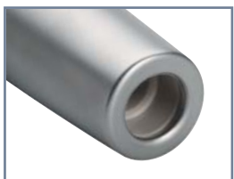
Unifix® - Unifix® L