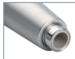
Roto Quick® - Roto Quick® lux