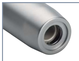
Multiflex® - Multiflex® lux